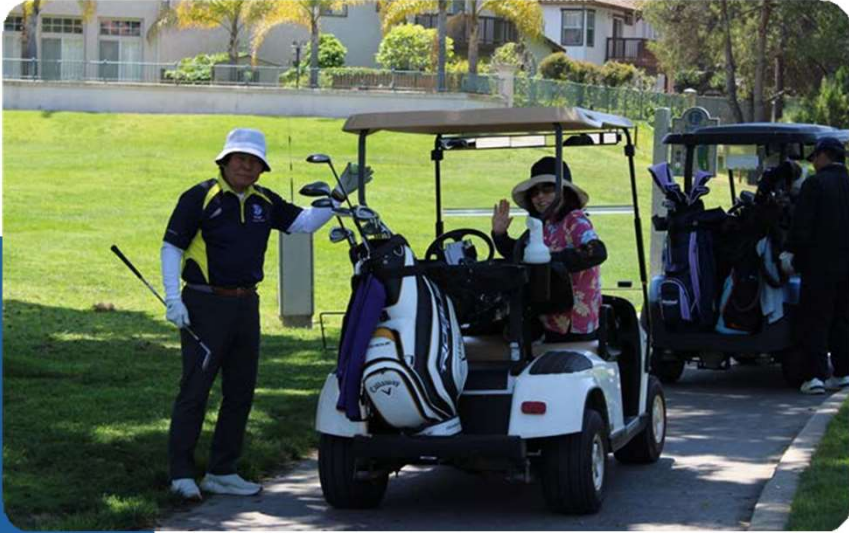
Los distribuidores y el personal de Enagic jugaron un torneo de 18 hoyos con el Sr. Ohshiro.