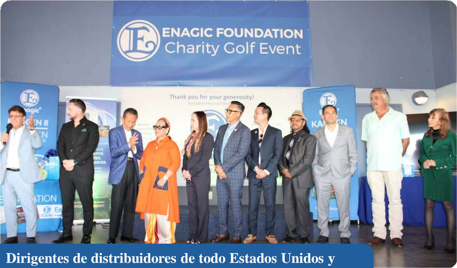
Dirigentes de distribuidores de todo Estados Unidos y Canadá patrocinaron el acto con importantes donaciones.