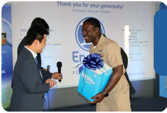
Este afortunado militar ganó un Anespa DX durante el sorteo con el evento.